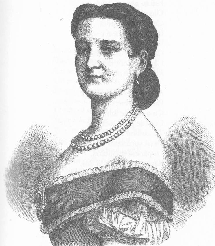
Carlotta Patti (1840–1889)

Sau ca lira sfărâmată, Ce răsgeme-ngrozitor, Când o mână înghețată Rumpe coardele-n fior, Astfel mâna-ți tremurândă